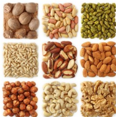
Fruits à coque